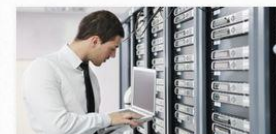
ADMINISTRATOR SIECI KOMPUTEROWYCH