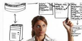
ADMINISTRATOR BAZ DANYCH